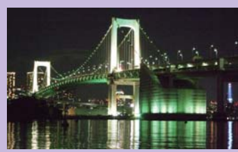
レインボーブリッジ

クルーズコンサルタント有資格者や船舶操縦資格を持った海に詳しいスタッフがお客様に最適なパーティープランをご提案いたします。